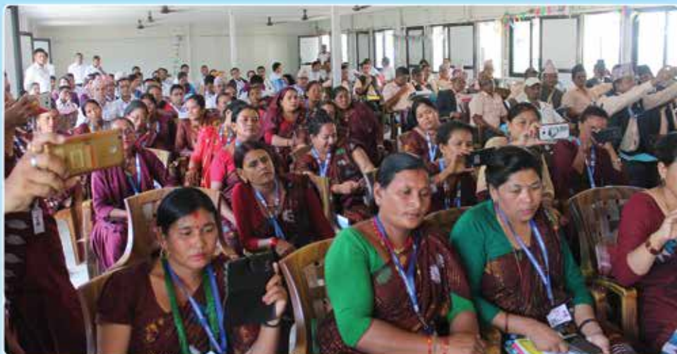
पाँचौ नगरसभामा उपस्थित नगर सभाका सदस्य ज्यूहरू ।