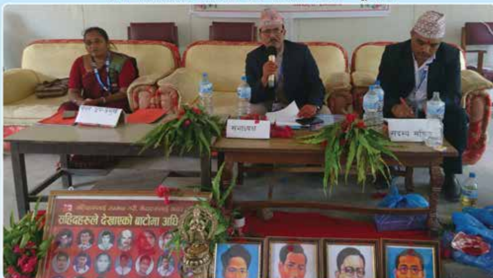
शहिदहरू प्रति माल्यार्पण पश्चात नगर सभाको शुरुवात गर्नुहुँदै नगर प्रमुख र सदस्य सचिव ।