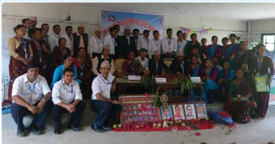
पाँचौ नगरसभा समापन पश्चात नगर प्रमुखसँग कर्मचारीहरू ।