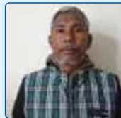
निरमान मास्नी कार्यपालिका सदस्य अल्पसंख्यक सदस्य