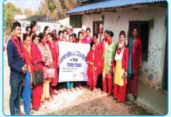
उद्धमशिलता तालिम सञ्चालन वडा नं. २ र ५