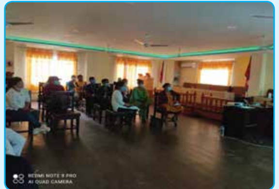
आप्रवासी कामदार हकहित संरक्षण मन्चको क्षमता