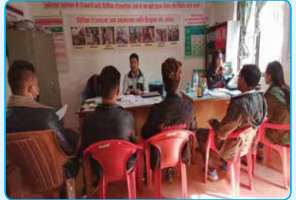
MRC मा परामर्श गर्दै