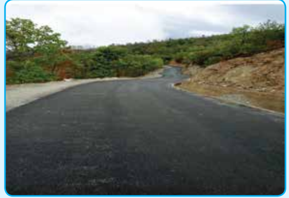
सुनारपानी कालोपत्रे सडक