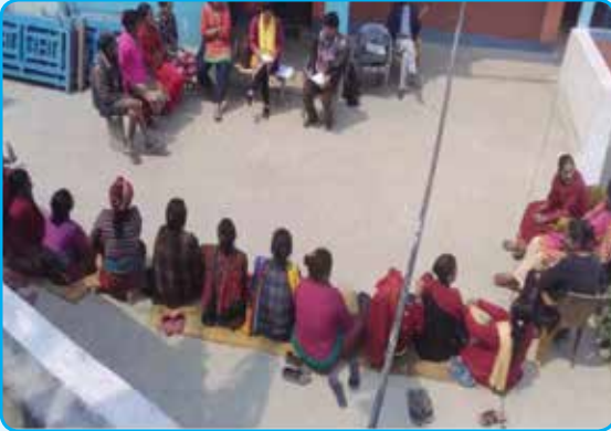
वित्तिय साक्षरता कक्षाका सहभागी छनोट कार्यक्रम