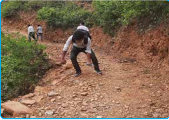
कुनौरीपाखा हुँदै हात्तीबार डाँडा सडक निर्माण