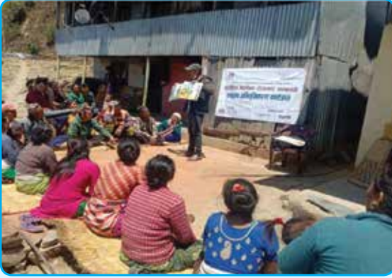
सु बै रो सम्बन्धी समुदाय अभिमुखीकरण