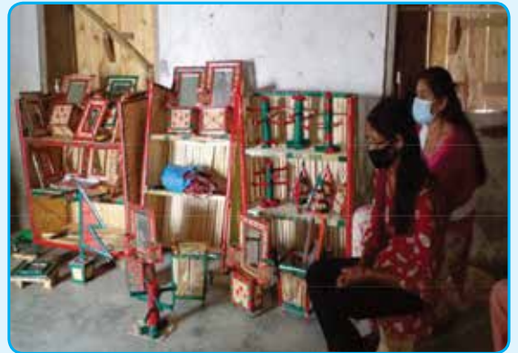
बाँसका हस्तकला तालिम