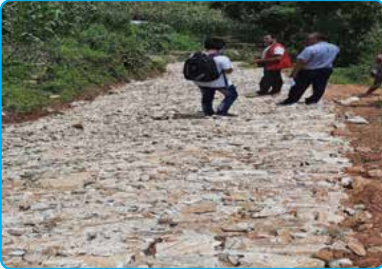
एकीकृत सडक मर्मत योजना- वडा नं. ८