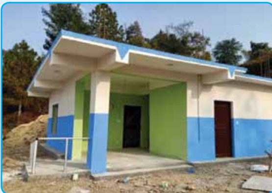
आधारभूत स्वास्थ्य केन्द्र मन्थली नपा १४