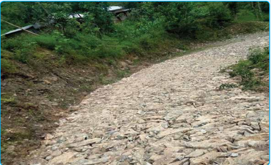
वडा नं १० चनखुमा निर्माण भएको कुलो र सडक स्तरोन्नती