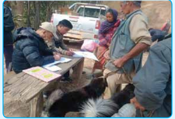
एउटा वडा एउटा जेनेटिक रोग (रेविज) तथा स्थलगत परजीवी नियन्त्रण कार्यक्रम