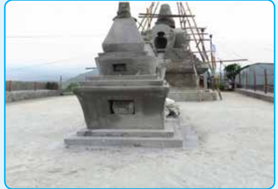
मन्थली नगरपालिका वडा नं १४ गुम्वा