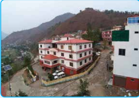
मन्थली नगरकार्यपालिकाको भवन