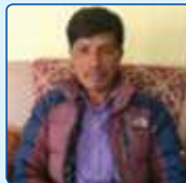
उद्व रस्तेल कार्यपालिका सदस्य दलित सदस्य