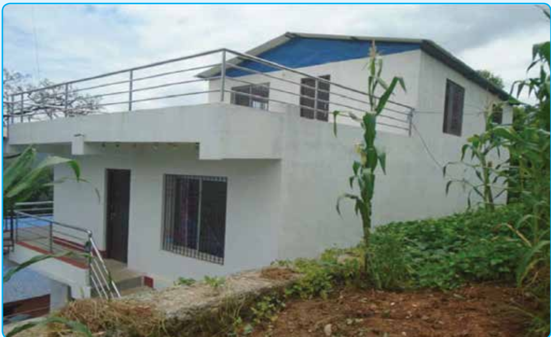
चिसापानी सँग्रहालय व्यवस्थापन र भिमेश्वर सामुदायिक सिकाई तथा सूचना केन्द्र हल निर्माण/व्यवस्थापन