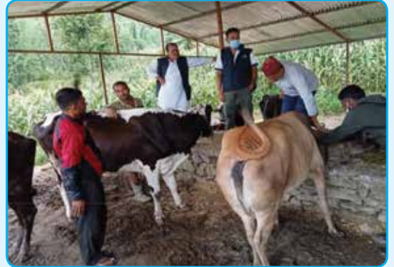
लागत साभेदारीमा गाई बाख्रा अनुदान कार्यक्रम