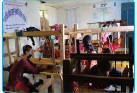
ढाका बुनाई तालिम