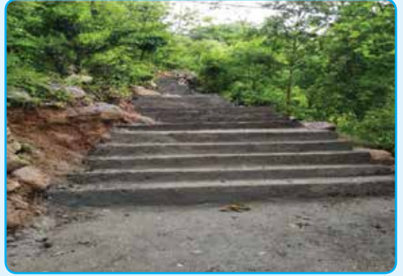
मन्थलीघाट देखि मन्थली गाल्पा जोड्ने गोरेटो बाटो स्तरोन्नती