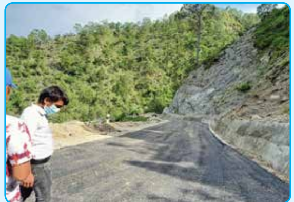
देविटार फुलासी पोखरी सडक