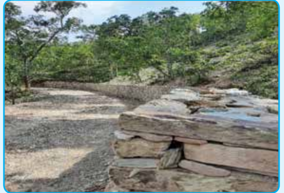
हे पो सडक स्तरोन्नती - वडा नं. ९