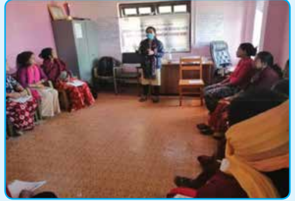
समुह मनोसामाजिक परामर्श