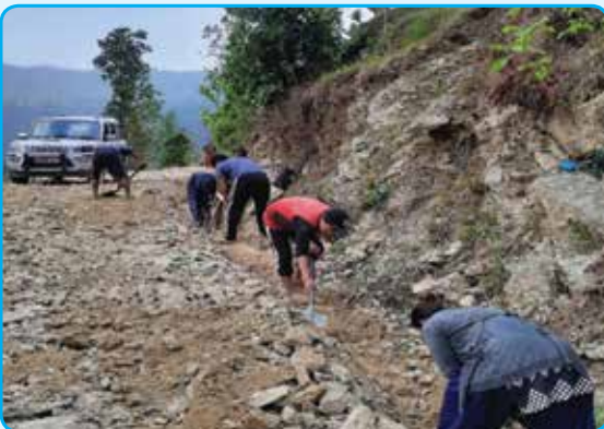
च्यानेगैरा नरवारी खमारे ऐमानटार बगरबेशी जिरोकीलो सडक स्तरोन्नती - वडा नं. १३