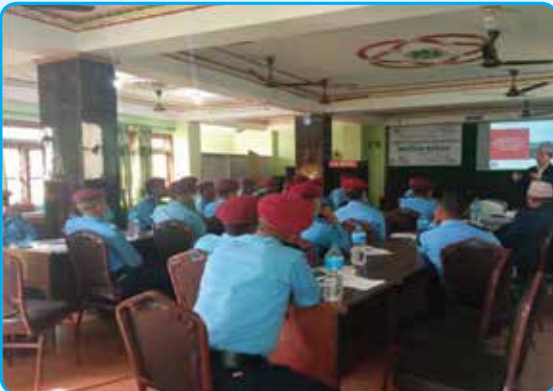
प्रहरीहरूसँग अन्तरक्रिया कार्यक्रम