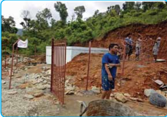
सुनारपानी खानेपानी लिफ्ट मन्थली नपा ५