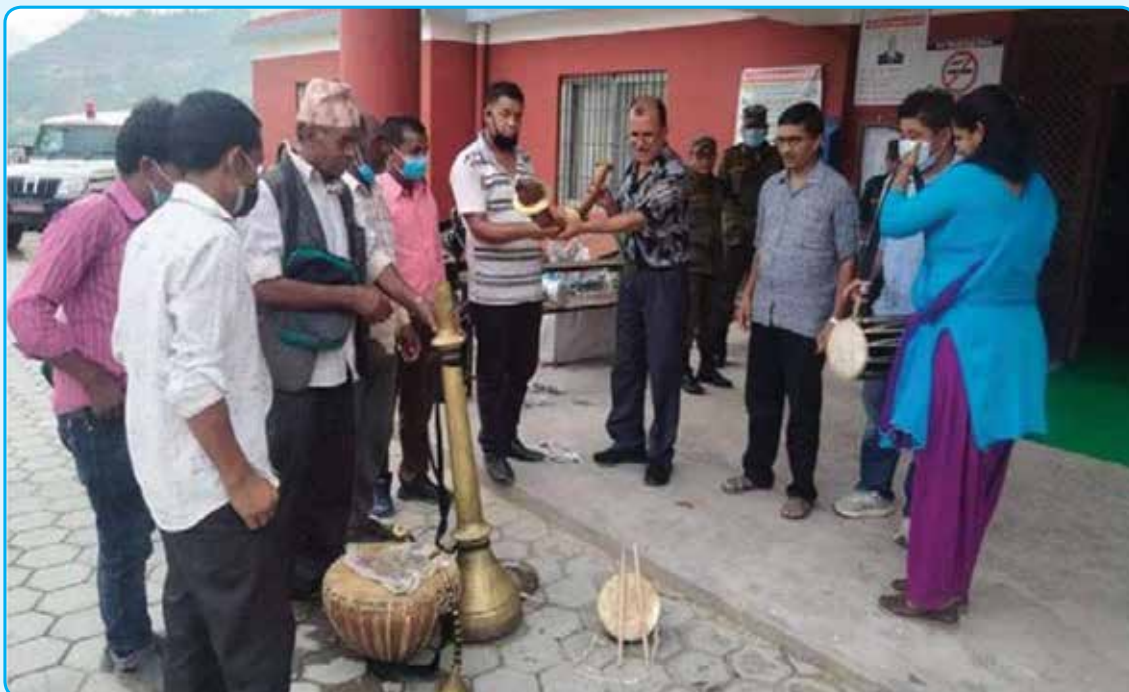
वडा नं ९, पुरानागाउँस्थित थानापती मन्दिर जाने बाटोमा सिँडी तथा रेलिङ्ग निर्माण र स्थानीय पञ्चे बाजाको सामाग्री हस्तान्तरण