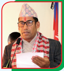
लव श्रेष्ठ नगर प्रमुख