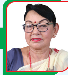
इश्वरी वस्नेत उप-नगर प्रमुख