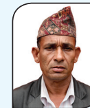
मान ब. वि.क. कार्यपालिका सदस्य