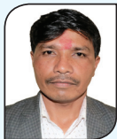
उद्व रस्तेल कार्यपालिका सदस्य